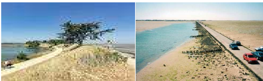
Polder de Sébastopol

Matin : Randonnée de 10/12 km dans le polder de Sébastopol (réserve naturelle) avec approche du passage du Gois.