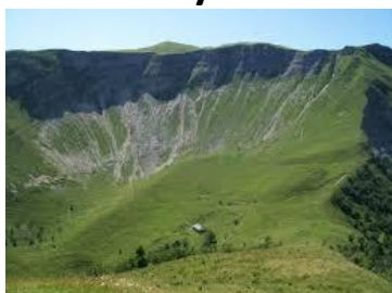
Colomby de Gex