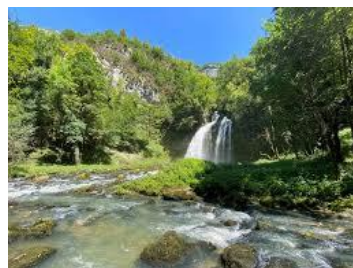
Les cascades de Flumen